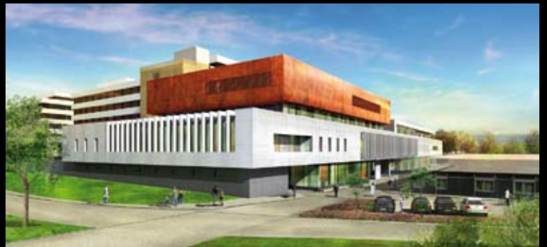
Centre hospitalier Montélimar – Sextant architecture