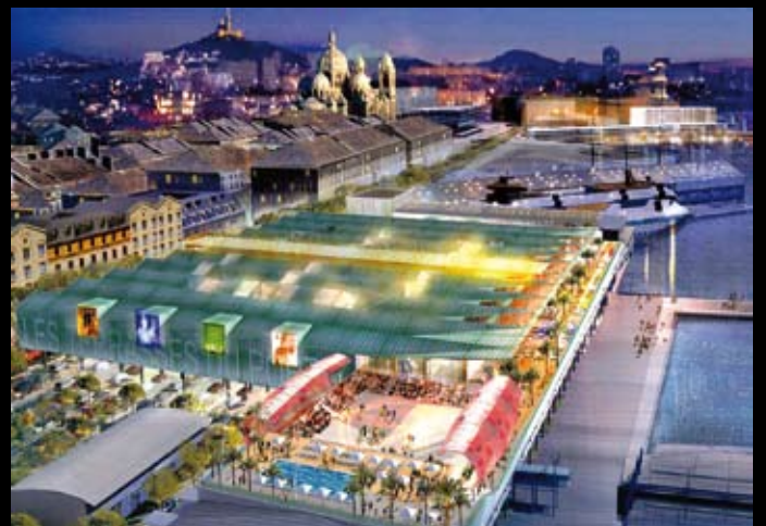
Les Terrasses du Port – Marseille – KERN architecture et urbanisme