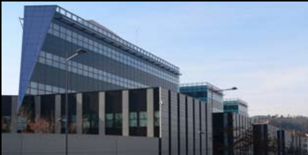
Siège social Groupe CASINO – Architecture Studio – Cimaïse