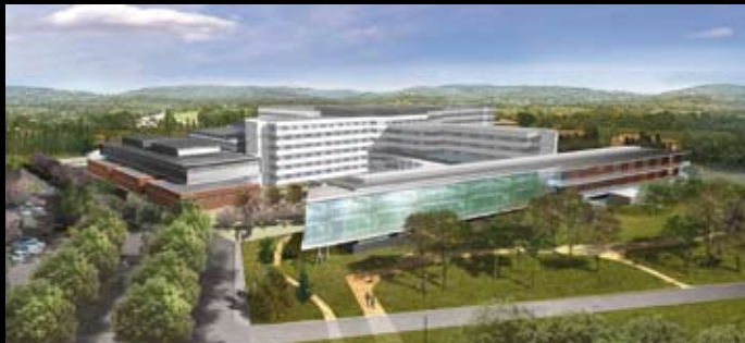
Centre hospitalier Villefranche-sur-Saône – C.R.B – Curtelin – Ricard – Bergeret