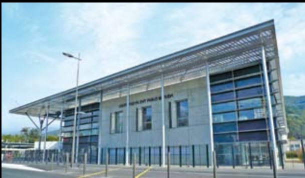
Lycée Pablo Néruda et Henri Fabre – Saint-Martin-d'Hères – Arc