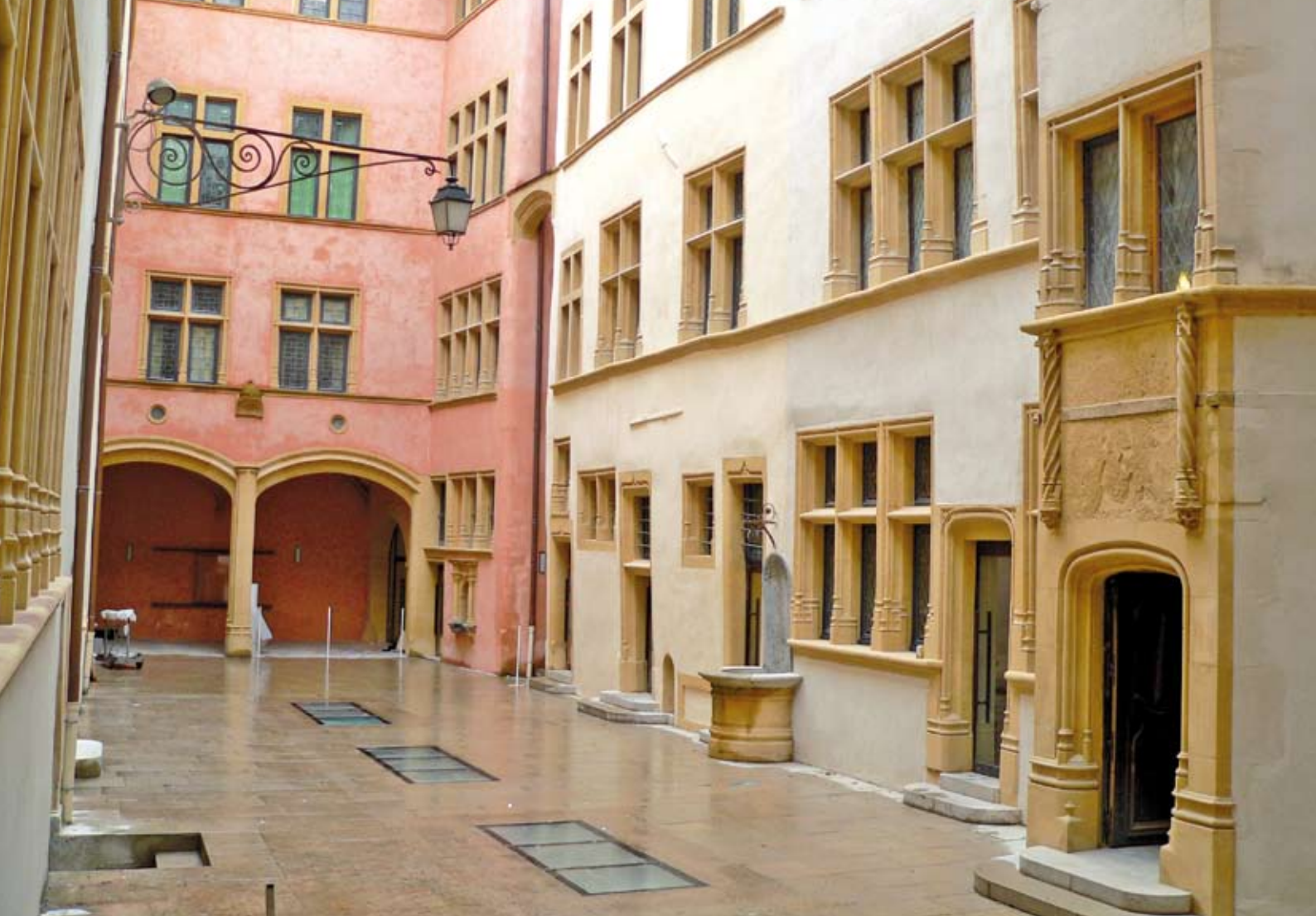
Musée de Gadagne – Lyon – François Pin – Catherine Bizouard