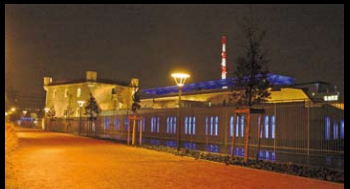
Hôtel de Police Fort Montluc – Lyon – At'las