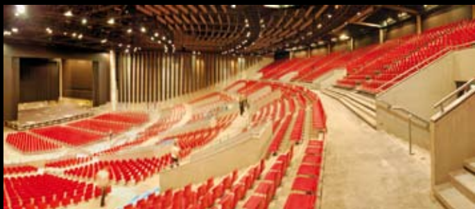
Zénith Saint-Etienne - Norman Foster – Dominique Berger