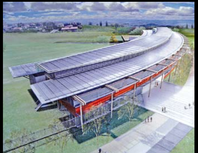
Lycée de Chazelles-sur-Lyon – At'las