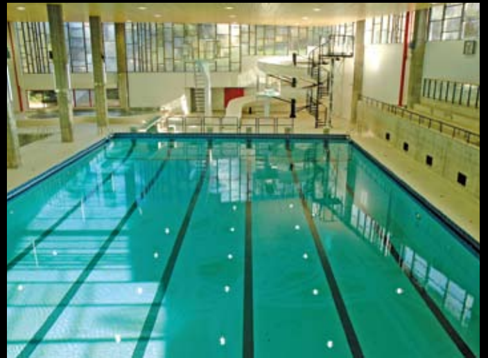
Piscine de Firminy – At'las