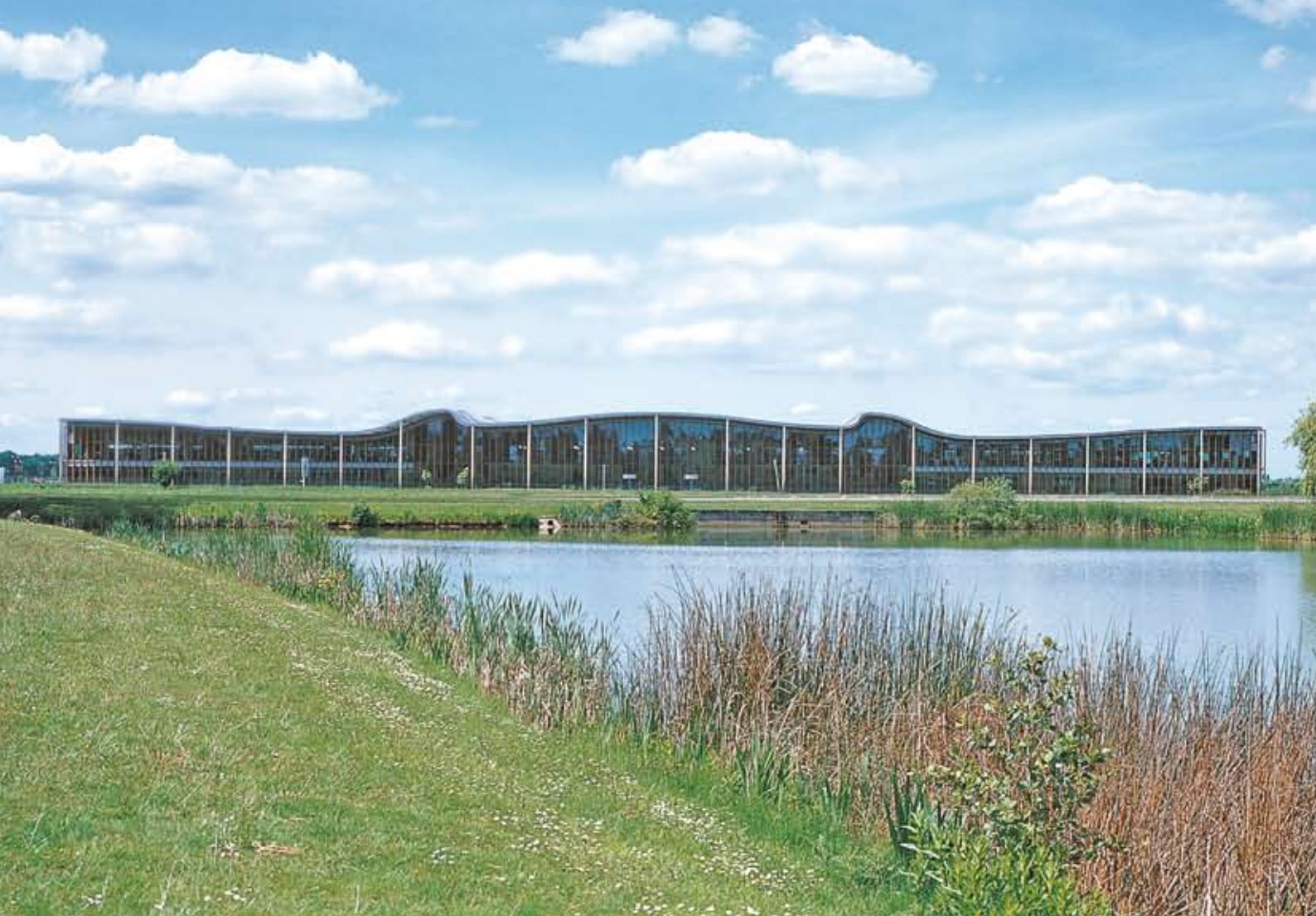
Centre mondial de Recherche & Développement – groupe DANONE – Paris – Architecture Studio