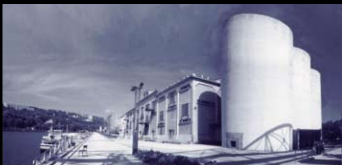
La Sucrière – At'las