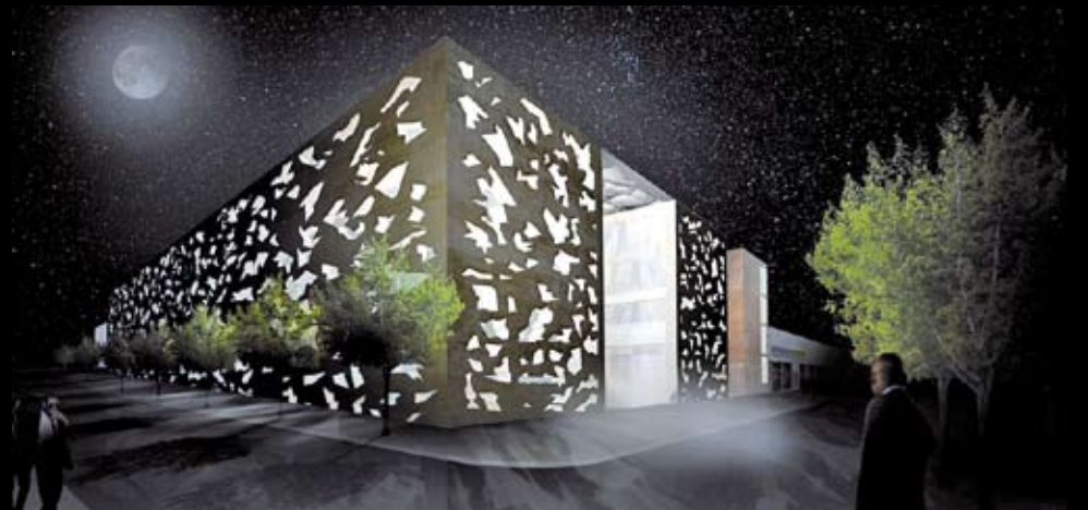
Maison pour l'emploi – Rudy Ricciotti