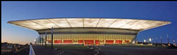
Zénith Saint-Etienne - Norman Foster – Dominique Berger