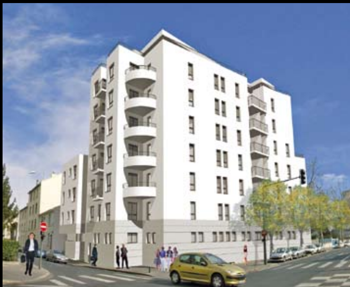
Esprit Lumière – Lyon – Groupe 5