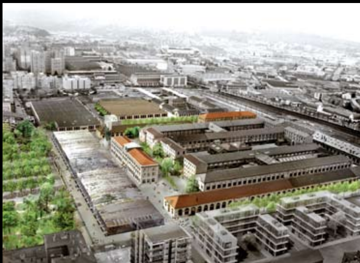
Cité du Design – LIN – Finn Geipel – Giulia Andi