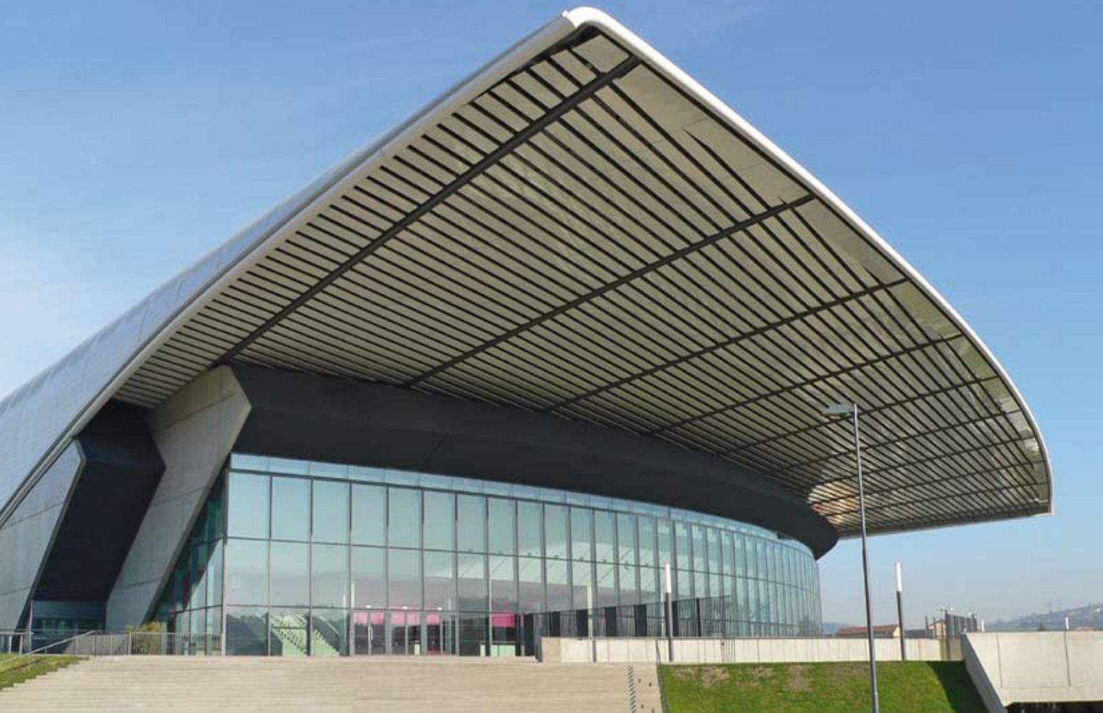
Zénith Saint-Etienne - Norman Foster – Dominique Berger