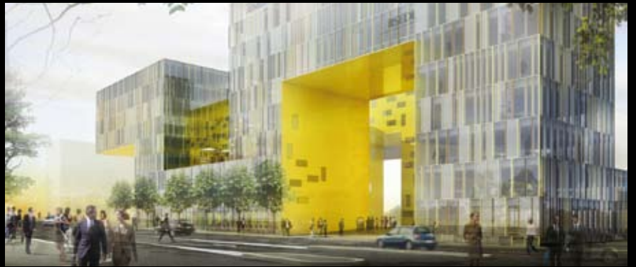
Pôle administratif – Saint-Etienne – Manuelle Gautrand