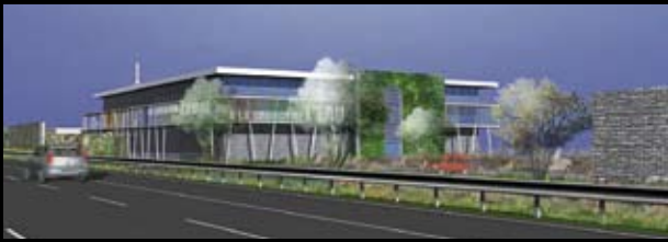
STEP de la Feyssine – Patriarche & Co

Economiste de la construction, bénéficiant d'une grande expérience dans les secteurs publics et privés, Cyprium s'implique tout au long de vos projets.