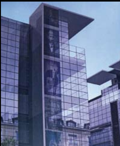
Bioparc - Lyon – Xanadu