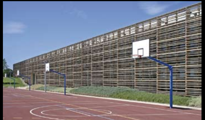
Lycée Lucie Aubrac – Bollène – AURA