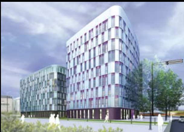
Clemenceau Marbotte Plaza – Dijon – Architecture Studio